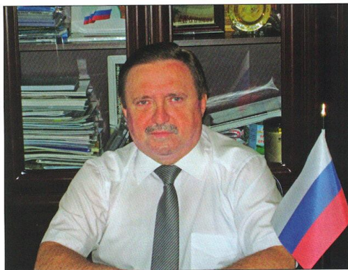
Торговый представитель Российской Федерации в Туркменистане — Александров Игорь Алексеевич

Почтовый адрес: 744000, Туркменистан, г. Ашхабад, ул. Мяты Косаева, д. 64 Б Тел.: (+993-12) 92-64-01, (+993-12) 93-54-39. Факс: (+993-12) 93-54-39. E-mail: tprf09@mail.ru