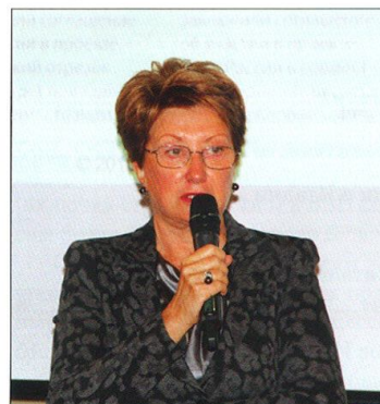
Торговый представитель России в Италии Н.О. Шенгелия